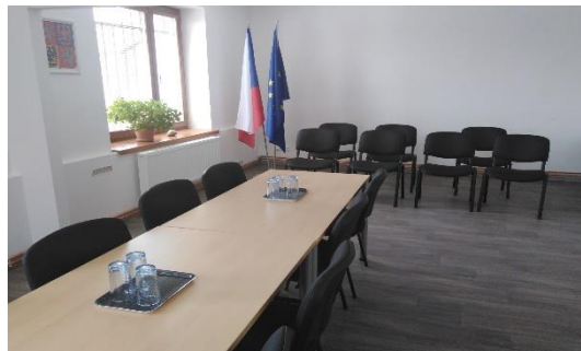
Foto: Zasedací místnost OÚ Kořenice

A k tomu bych chtěla zdůraznit, že Obecní úřad Kořenice vykonává reprezentativní funkci a není vizitkou pouze jeho zaměstnanců, ale všech občanů ze všech částí obce, tedy Kořenic – Chotouchova – Pučer. Myslím, že tento krok se nám velmi povedl. Zástupcům firem i dalších obcí a samotným úředníkům nadřízených orgánů se na úřadě velmi líbí a rádi se k nám vracejí, což je vizitkou nás všech.